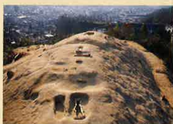
山の神第2~4号古墳 (写真奥より2・3・4号古墳)

箱式石棺は身長に合わせて造るため、子どもの箱式石棺は大人に比べて小さいものが普通ですが、2人が埋葬されていた箱式石棺は大人サイズのものでした。もし、キョウダイの前に大人が埋葬されていたとすれば、その大人は2人と非常に近い関係にあったと思われる。