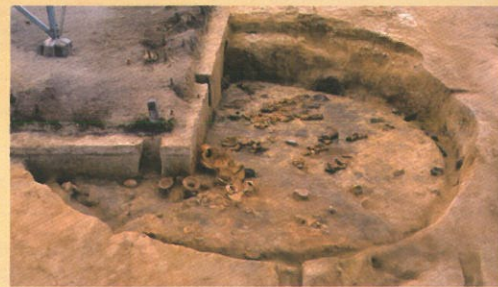
西本3・4号遺跡 住居跡・遺物出土状況