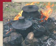
土器で炊けるかな?