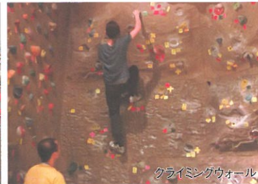
クライミングウォール