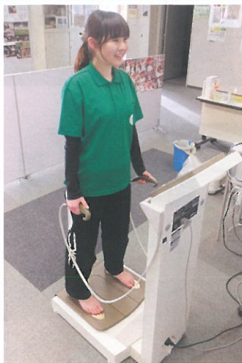
インボディ(体組成測定)