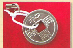
できたて!ピカピカのお金