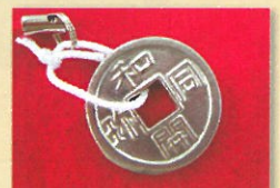
できて!ピカピカのお金