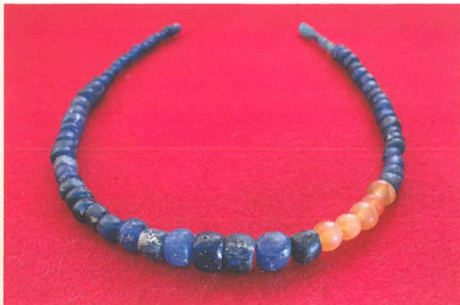
須賀谷第2号古墳(広島市東区温品)出土ガラス玉 ガラスは本来無色透明ですが、溶かす際に銅や鉄・コバルトなどを加えることにより、緑色や黄色・褐色、紺色(コバルトブルー)などの美しい色に着色することができます。

※松ヶ迫矢谷遺跡のガラス玉は三次市の広島県立歴史民俗資料館に常設展示されています。