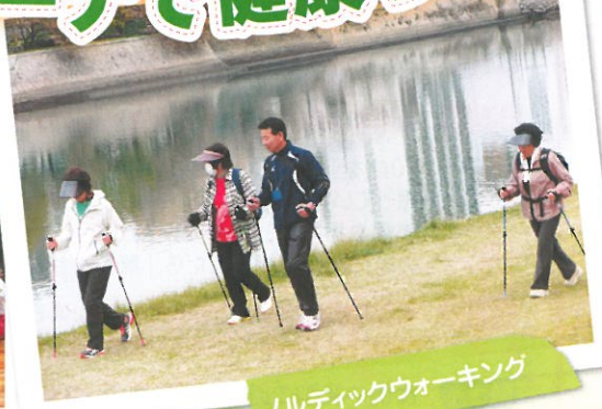
ノルディックウォーキング