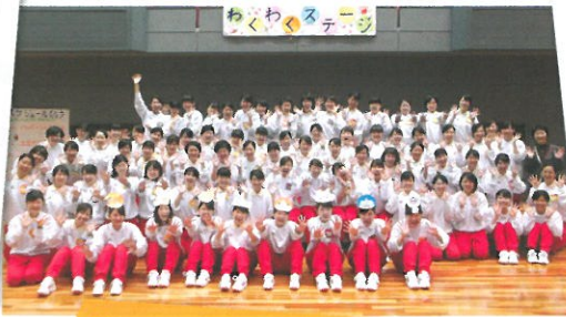
グリーンアリーナ☆サポート隊の皆さん