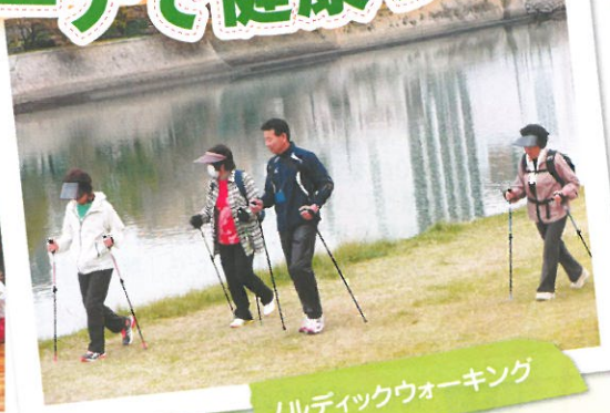
ノルディックウォーキング