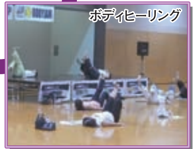
ボディヒーリング