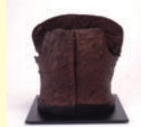
曲第2号古墳出土短甲