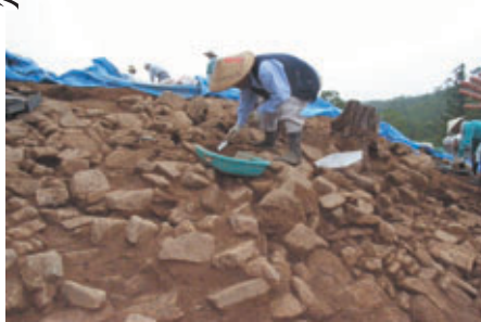
宮の本第24号古墳（三次市）