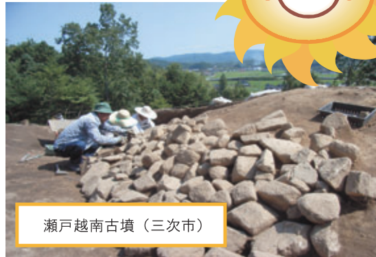
瀬戸越南古墳（三次市）