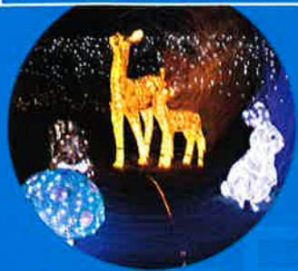
広島グリーンアリーナ☆イルミネーション