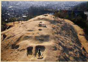
山の神第2~4号古墳 (写真奥より2・3・4号古墳)

平成8(1996)年に調査された山の神遺跡群(府中市)からは、新たに3基の古墳(山の神第2~4号古墳)が見つかりました。そのうち、第3号古墳は2つの箱式石棺をもつ古墳で、そのうちの1つ(第1号主体部)からは2体分の歯が見つかりました。歯はいずれも子どものもので、9歳前後および7歳前後の小児のもので、2体は並んで埋葬されており、間には銅鏡が置かれていました。また、9歳の子どものそばから管玉とガラス小玉が見つかりました。小児の合葬は広島県唯一です。2人は歯の分析から血縁関係である可能性が高く、キョウダイだったのではないかと考えられます。1人が先に埋葬され、ほどなくしてもう1人が合葬されたようです。