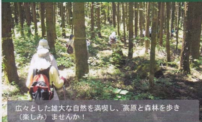
広々とした雄大な自然を満喫し、高原と森林を歩き(楽しみ)ませんか！