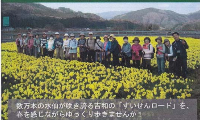
数万本の水仙が咲き誇る吉和の「すいせんロード」を、春を感じながらゆっくり歩きませんか！