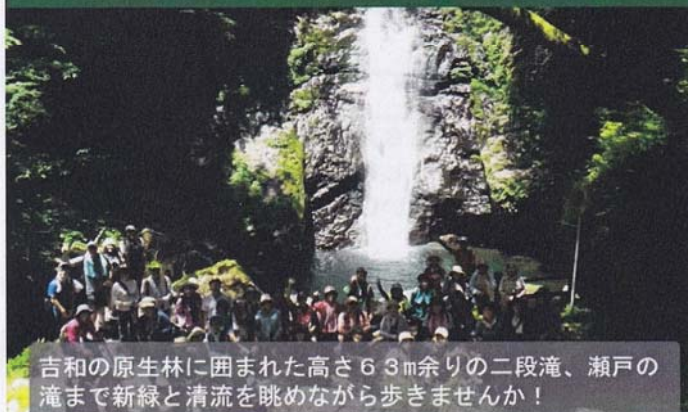
吉和の原生林に囲まれた高さ63m余りの二段滝、瀬戸の滝まで新緑と清流を眺めながら歩きませんか！