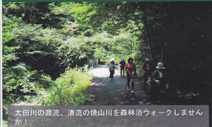
太田川の源流、清流の焼山川を森林浴ウォークしませんか！

【時間】 10:00～ (受付 9:40～) 【集合場所】 クヴェーレ吉和 【定員】 20名