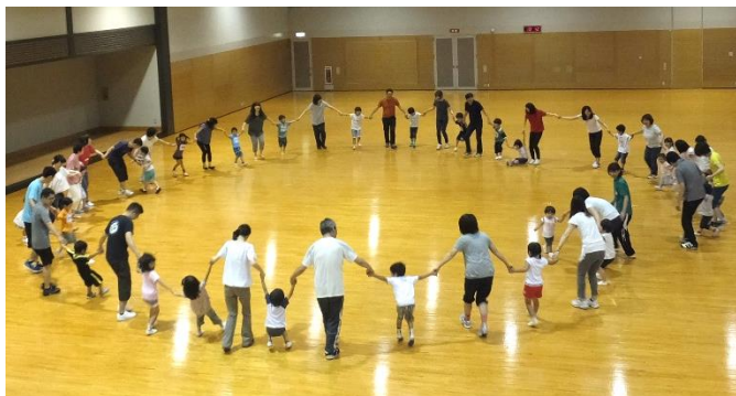
みんな大すき！パパママたいそう