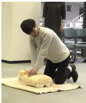
スポーツセーフティー講習会