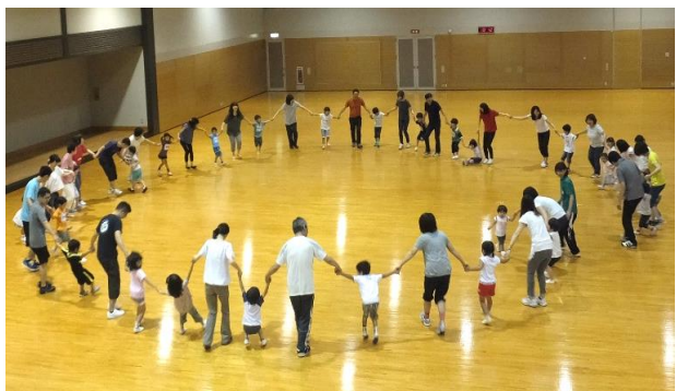
みんな大好き！パパママたいそう