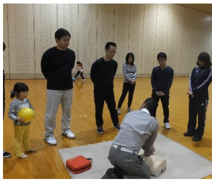
スポーツセーフティー講習会