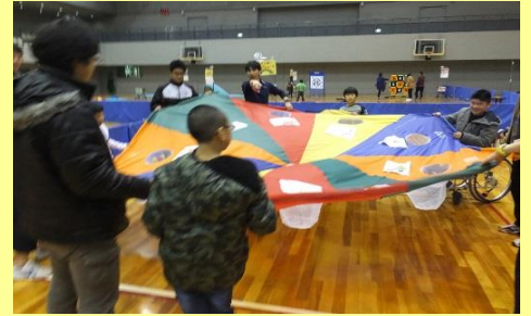
☆レインボー マッチシュート☆