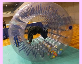
☆くるくるバルーン☆